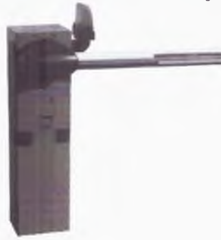
Рис. Внешний вид шлагбаума (образец)

Шлагбаум состоит из круглой алюминиевой стрелы (антиветер) белого цвета с зеркальными отражательными поперечными полосками красного и белого цвета, а также стальной стойки, обработанной катафорезом и покрашенной полиэфирной краской в оранжевого цвета. Стойка шлагбаума снабжена сигнальной лампой желтого цвета для предупреждения водителей транспортных средств и пешеходов, об опускании (поднятии) стрелы шлагбаума.